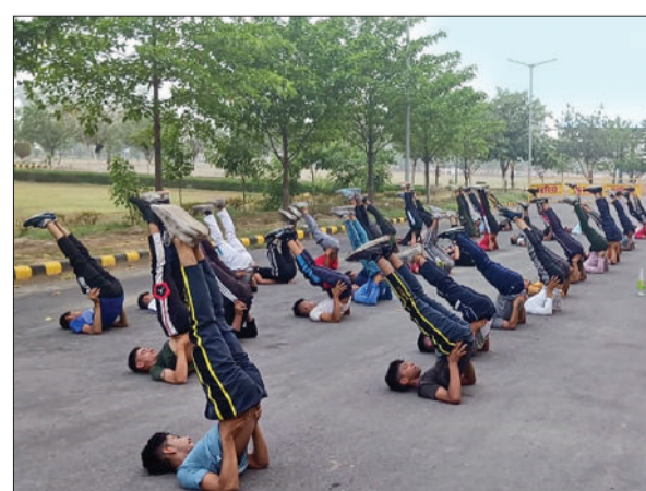
जीद। एनसीसी कैडेट प्रशिक्षण लेते हुए।

उचाना। मुख्यमंत्री नायब सिंह सैनी से चंडीगढ़ स्थित निवास पर हरियाणा प्रदेश के एमबीबीएस, बीडीएस विद्यार्थियों के शीर्ष नेतृत्व ने उनसे मुलाकात की। इस मुलाकात में एमबीबीएस, बीडीएस इंटरनर्स को मिलने वाले स्टार्टअप में बढ़ोतरी को लेकर चर्चा हुई। मुख्यमंत्री ने मामले का संज्ञान लेते हुए तुरंत प्रभाव से अपने अधिकारियों को शिकायतों का निवारण करने का आदेश दिया। अधिकारियों की तरफ से फाइल के फाइनेंस मिनिस्ट्री में होने की जानकारी मिलते ही विद्यार्थी प्रतिनिधिमंडल ने वित्त मंत्री जय प्रकाश दलाल के चंडीगढ़ स्थित निवास स्थान पर जाकर उनसे मुलाकात की। इस मुलाकात में एमबीबीएस, बीडीएस इंटरनर्स को मिलने वाले स्टार्टअप में बढ़ोतरी को लेकर चर्चा हुई। वित्त मंत्री ने विद्यार्थियों को स्टार्टअप में स्वास्थ्य विभाग की सिफारिशों के अनुसार वृद्धि का वायदा किया।