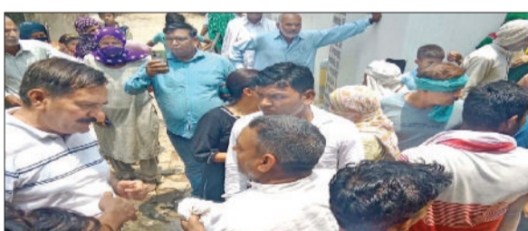
जीद। लोगों को जल संरक्षण के प्रति जागरूक करते अधिकारी।