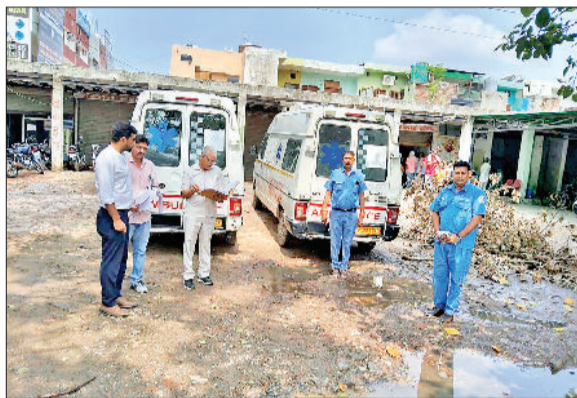
जींद। सीएम फ्लाईंग टीम एंबुलेंस की जांच करते हुए।