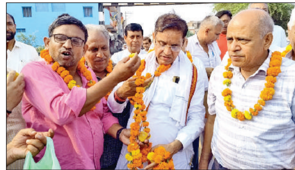
जीद। महाबीर कम्प्यूटर का स्वागत करते व्यापारी।

पंजीकरण सुनिश्चित करें तथा इस पोर्टल के माध्यम से रिपोर्ट तैयार करें, जो गर्भवती के पहले कितने लड़कियां तथा लड़के हैं, लिंग जांच के लड़कियों वाली गर्भवती महिला को ट्रैक पर रखा जा सके। आरसीएच पोर्टल के साथ आशा वर्क के रजिस्टर से भी रिपोर्ट तैयार करें कि जो गर्भवती महिला के पहले कितने लड़कियां तथा लड़के हैं, जिससे अधिक लड़कियां वाली गर्भवती महिला को ट्रैक रखा जा सके। शिक्षा विभाग के अधिकारी को भी बेटी बचाओ बेटी पढ़ाओ अभियान में शामिल करें। स्कूल स्तर पर भाषण, ड्राइंग आदि प्रतियोगिता का आयोजन किया जाए, जिससे इस स्तर के बच्चे समाज में कन्या भ्रूण हत्या जैसे बुराईयों को समझ सकें।