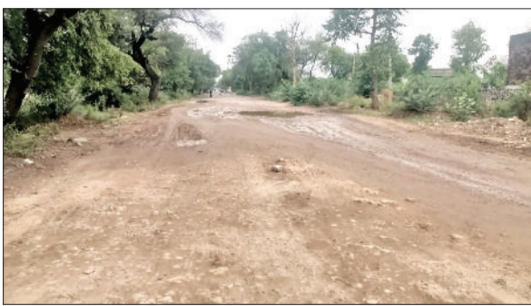
जुलाना में सड़क की खस्ता हालत।

कस्बे के आंतरिक रोड़ का 9 करोड़ 25 लाख रूपये की लागत में जीर्णोद्धार किया जाएगा। जुलाना के ब्राह्मणवासा गांव से लेकर सोनिया स्कूल तक एनएच 352 की हालत खस्ता बनी हुई है। काफी सालों से क्षेत्र के लोगों की मांग रही है कि जल्द से जल्द सड़क का निर्माण किया जाए ताकि योजना हो रहे हादसों से छुटकारा मिल सके। सड़क पर काफी गहरे गड्ढे बने हुए हैं। कई बार हादसे भी हो चुके हैं। ब्राह्मणवासा गांव के पास तो बरसात होते ही वाहन चालकों का