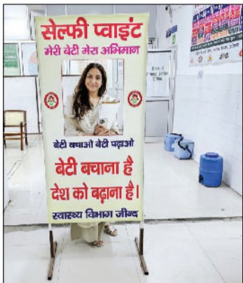
जीद। स्वास्थ्य विभाग द्वारा बनाया गया सैल्फी व्हाइट।

उन्होंने बताया कि 2018 से 2023 तक जिला जीद का लिंगानुपात 900 से ऊपर रहा है लेकिन 2024 में लिंगानुपात में काफी गिरावट आई है, इसमें सुधार होना जरूरी है। उन्होंने कहा कि लिंगानुपात में सुधार के लिए स्वास्थ्य विभाग, महिला बाल विकास विभाग, शिक्षा विभाग पुलिस को आपसी