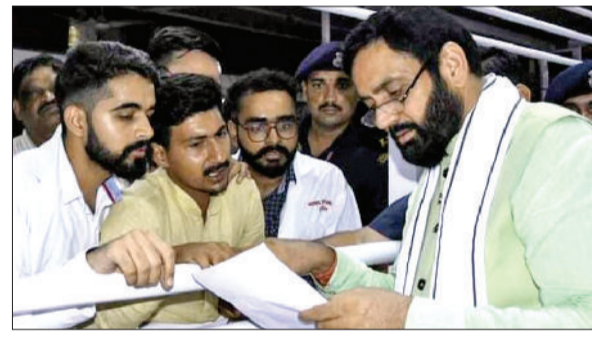
सीएम नायब सिंह सैनी से मिलते एमबीबीएस, बीडीएस विद्यार्थियों का प्रतिनिधि मंडल।

व सब्जी के लिए स्थाई रूप से लगाए पानी के कनेक्शन काटे गए। टीम द्वारा जागरूक करने के पश्चात जब खुले नल बंद किए गए तो जोन में आखिरी के घरों तक भी पानी पहुंच गया। टीम द्वारा आधे इंच से बड़े साइज के व डबल कनेक्शन वालों को नोटिस दिया गया।