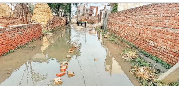
राजौद। वार्ड नंबर 13 गली में भरा पानी का दृश्य।