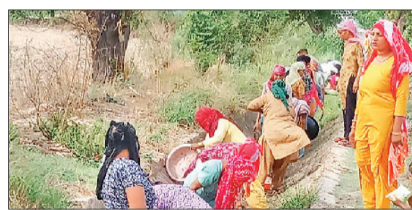
राजौद। खेड़ी राय वाली में मनरेगा के तहत नहर पर कार्य करते नरेगा मजदूर।

विभाग पर थोपने का काम करते हैं और कुछ लोगों की गलती की सजा सभी नागरिकों को भुगतनी पड़ती है। जहां पर घरों में भैंसों की डेयरी बनाई हुई है वहां तो और भी बुरा हाल है वहां पर सीवर गोबर की वजह से बंद हो जाते हैं और तो और काफी मात्रा में भैंसों की जेर भी सीवर मैनहाल में सफाई के समय मिलती है।