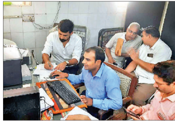
जींद। सीएम फ्लाईंग टीम रिकॉर्ड की जांच करते हुए।

चालक, ईएमटी के पद खाली तो, बायोमेट्रिक खराब, तथा जीपीएस भी नहीं मिले काम करते दो गाड़ियों के सीसीटीवी भी मिले खराब