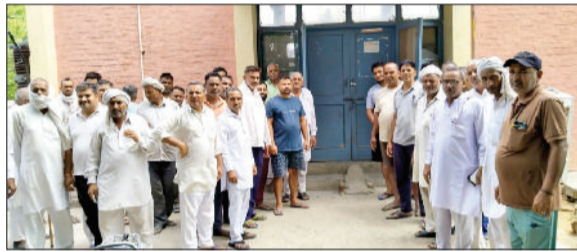
सफ़ीदों। तालाबंदी करते हुए किसान।

उपमंडल के गांव सिंधाना स्थित 33केवीए पावर हाउस पर तीन गांवों के किसानों ने बिजली समस्या को लेकर तालाबंदी कर दी। सुबह ही गांव सिंधाना, पाजू व छापूर के किसान पावरहाउस पर पहुंचे और बिजली कर्मचारियों को शैड्यूल पहले वाला करने की मांग की। जिस पर बिजली कर्मचारियों ने कहा कि उच्चाधिकारियों के जैसे आदेश है उसके अनुसार ही बिजली उपलब्ध कराई जाएगी। उसके बाद ग्रामीणों ने अधिकारियों को फोन मिलाए लेकिन कोई जवाब ना मिलने पर ग्रामीण भड़क गए। भड़के ग्रामीणों ने पावर हाउस के कर्मचारियों को बाहर कर वहां पर ताला जड़ दिया। ग्रामीणों की मांग थी कि उन्हें पहले चल रहे शैड्यूल के मुताबिक ही बिजली दी जाए। ग्रामीणों का कहना था कि यह