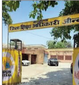
जिला शिक्षा अधिकारी का कार्यालय